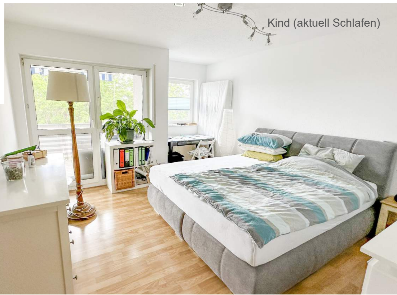
Kind (aktuell Schlafen)